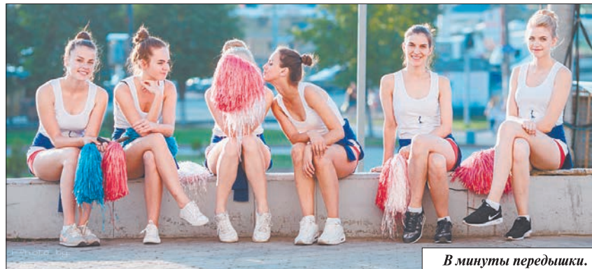
В минуты передышки.

жизни, теперь я стала более уверенной в себе и знаю, что в любой ситуации смогу принять правильное решение. А это очень важно, особенно когда я с дипломом ИВГПУ приду работать в новый коллектив.