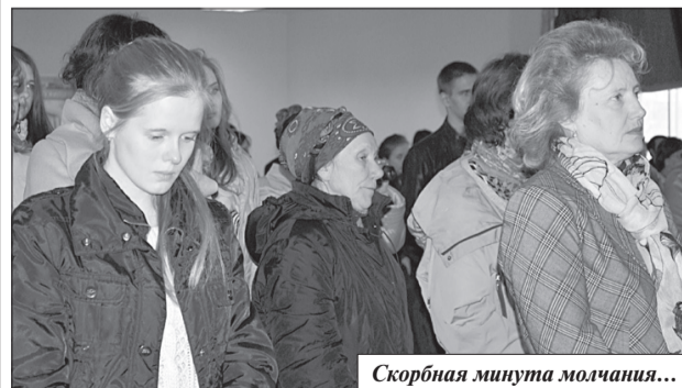
Скорбная минута молчания...