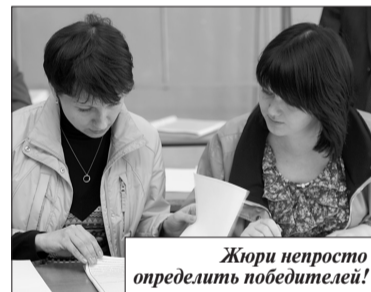
Жюри непростительно определить победителей!

Завершился III тур Всероссийской студенческой олимпиады и Всероссийского конкурса выпускных квалификационных работ по специальности 270106 (290600) «Производство строительных материалов, изделий и конструкций», который проводился на базе Ивановского государственного политехнического университета в период с 22 по 24 апреля.