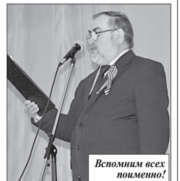
Вспомним всех поименно!