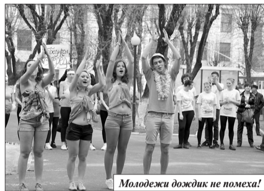
Молодежи дождик не помеха!