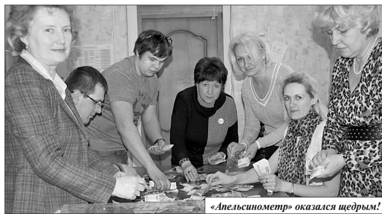
«Апельсинометр» оказался щедрым!