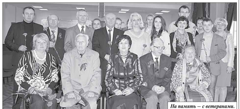
На память – с ветеранами.