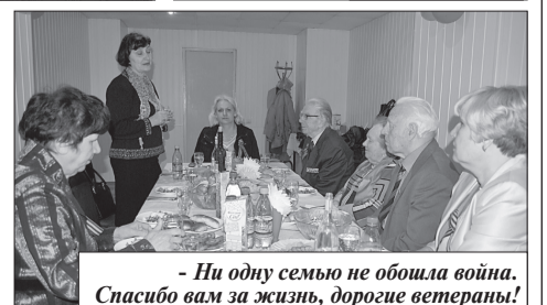
– Ни одну семью не обошла война. Спасибо вам за жизнь, дорогие ветераны!