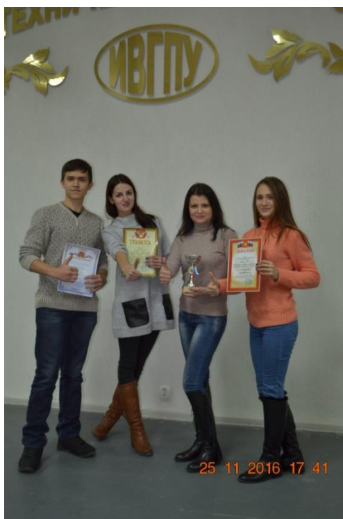
Губкинский филиал ФГБОУ ВО «Белгородский государственный технологический университет им. В.Г. Шухова»

Команды были награждены дипломами и кубками победителей. Каждый из участников был отмечен именной грамотой за участие в олимпиаде.