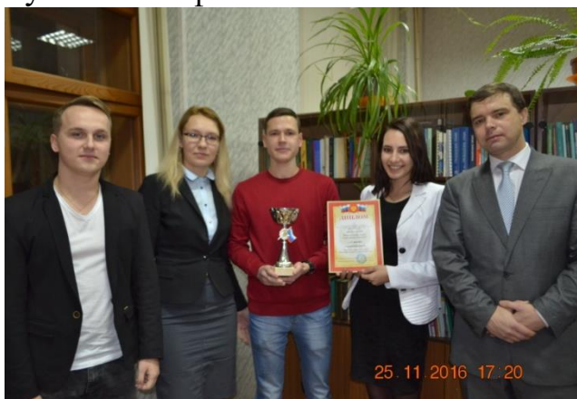
ФГБОУ ВО «Ивановский государственный политехнический университет»

На 1 место в командном зачете по результатам оценки всех этапов олимпиады вышла команда ИВГПУ, 2 место заняла команда ВлГУ, 3 место – Губкинский филиал БГТУ.