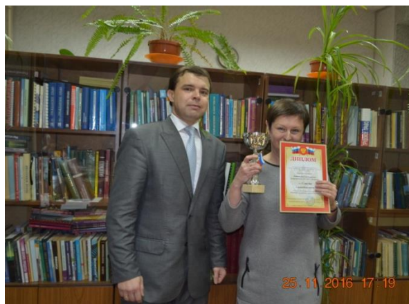
ФГБОУ ВО «Владимирский государственный университет»