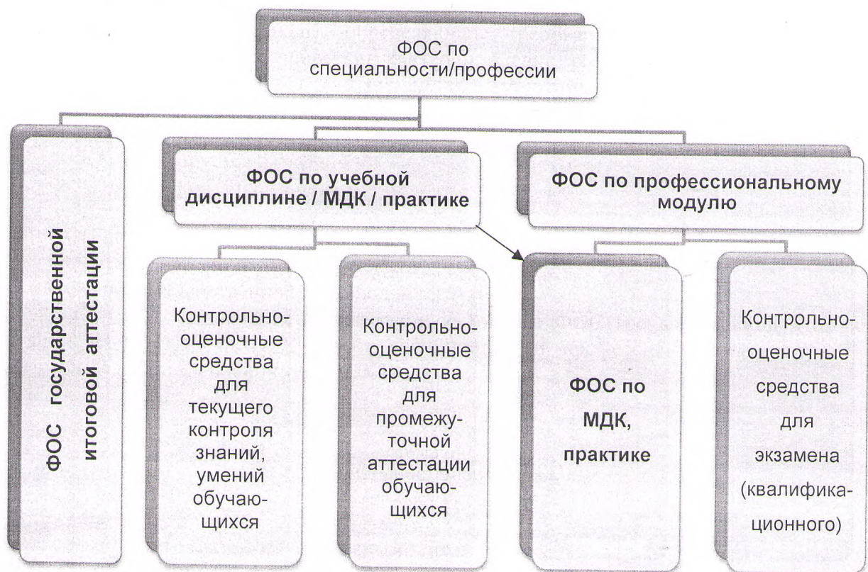
Рисунок 1 – Фонд оценочных средств по специальности/профессии