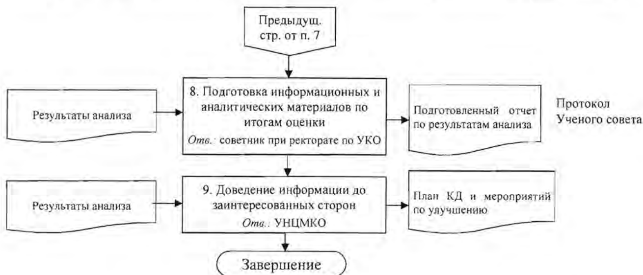
Рисунок 1 - Графическое описание процесса "Организация системы НОКО".

7.3 Обработка, накопление и анализ информации, полученной в ходе НОКО, проводится работниками университета в соответствии с должностными обязанностями.